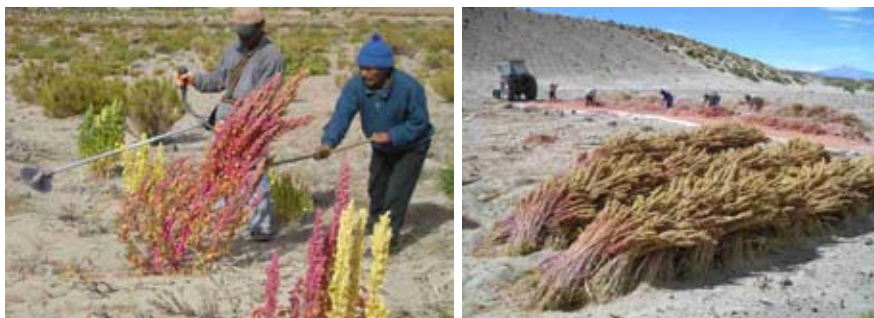
Tareas de cosecha de Quinua en Oruro. Los tallos necesitan cuidado y destreza al ser cortados para obtener el grano que es concentrado antes de separarse de otros elementos y ser procesado en las plantas de industrialización que lo copian, procesan y embolsan.